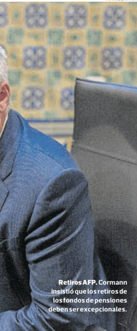
Retiros AFP. Cormann insistió que los retiros de los fondos de pensiones deben ser excepcionales.

nuevos beneficios tributarios. Si bien también compete al Gobierno, el Congreso impulsa primero. ¿Cómo evalúan esa dinámica de aprobación? Tenemos que hacer una distinción entre las recomendaciones que damos como sugerencias y las que son requisitos esenciales para ser miembros de la OCDE.