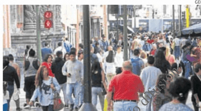
Elecciones. La incertidumbre política de cara a las elecciones generales del 2026 podría afectar aún más la inversión, indica la Organización.

Además, el gasto público se moderará a medida que se retome la consolidación fiscal. Y, se prevé que el crecimiento de las exportaciones disminuya por la menor demanda global y la imposición de nuevos aranceles de Estados Unidos.